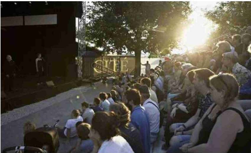
La scène «perchée» sur l'esplanade du Château.

Lausanne Les festivaliers inondent à nouveau les rues de la Cité. La manifestation revient à ses fondamentaux qui l'ont rendue si populaire